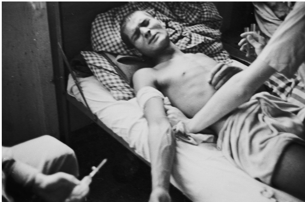
Eine Versuchsperson der Meerwasserexperimente in Dachau, ca. Juli–September 1944